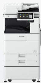
iR ADV DX 4700